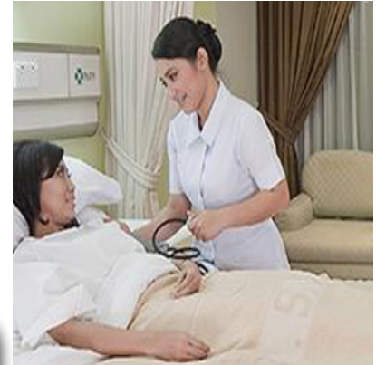
● Gambar: Giving Medication

Ketika bidan memberikan obat kepada pasien, biasanya ada beberapa pertanyaan dari pasien sehubungan dengan pemberian obat Jenis pertanyaan yang biasanya muncul adalah: