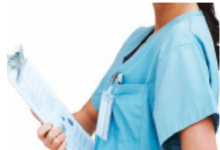
● Gambar: Filling Medical Report