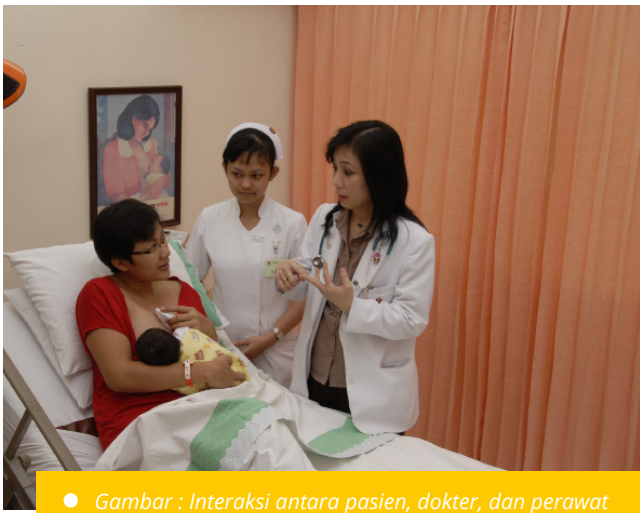
● Gambar : Interaksi antara pasien, dokter, dan perawat

The first good impression yang dapat dilihat dari seorang bidan selain penampilan adalah bagaimana cara berkomunikasi. Di era globalisasi bidan diharapkan mampu menguasai dunia dengan kemampuan berbahasa Inggris. Saat ini sudah kita lihat dengan banyaknya orang luar negeri datang ke Indonesia diharapkan bidan dapat memberikan pelayanan dengan meningkatkan kemampuan berbahasa Inggris.